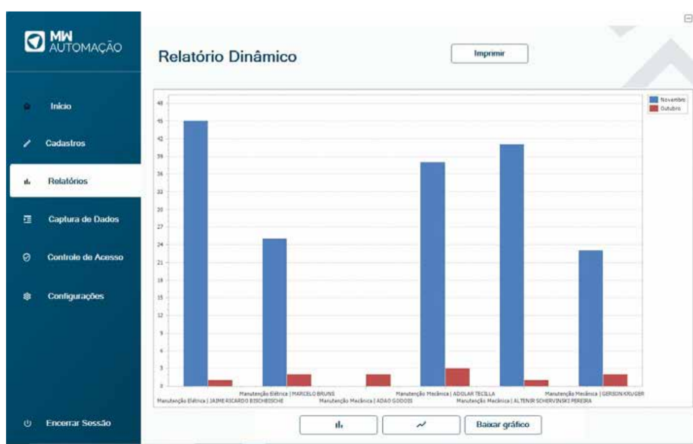
Software customizável e pode ser integrado ao seu ERP