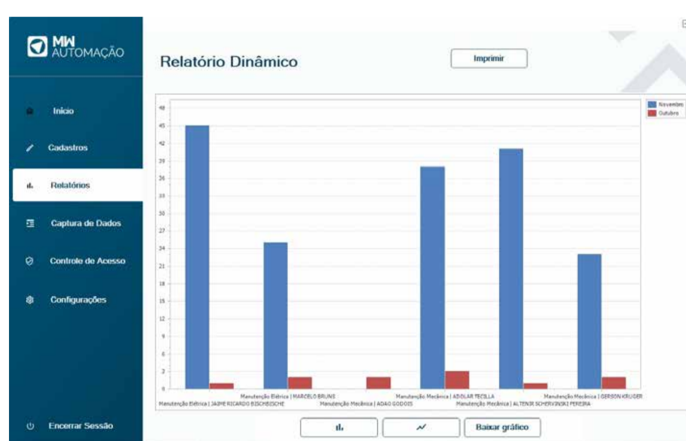
Software customizável e pode ser integrado ao seu ERP