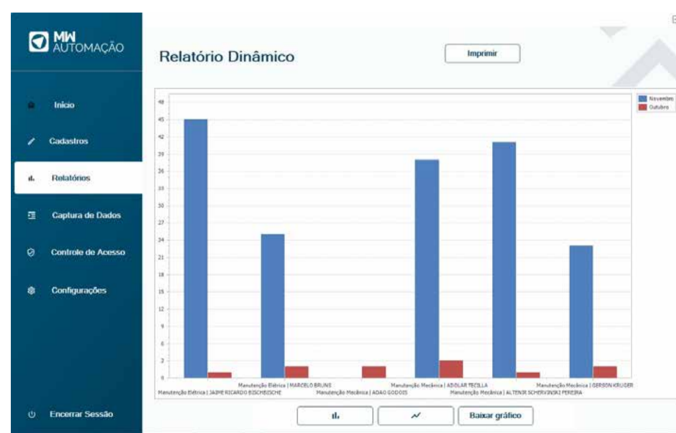
Software customizável e pode ser integrado ao seu ERP